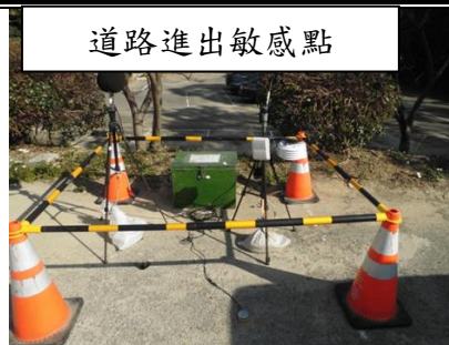
圖 1.4 環境監測位置圖